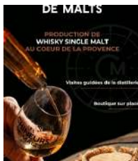
©Visite de l'orge au whisky en anglais - Les chineurs de malt, Le Thor