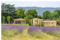
©De la vigne au verre au Château de Sannes, Sannes