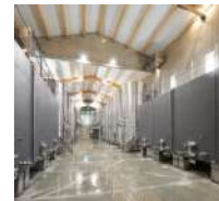
©Atelier dégustation guidée par l'impasse : introduction gustative