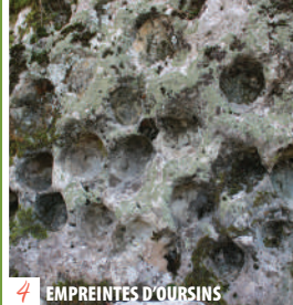
4 EMPREINTES D'OURSINS