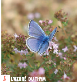
5 L'AZURÉ DU THYM