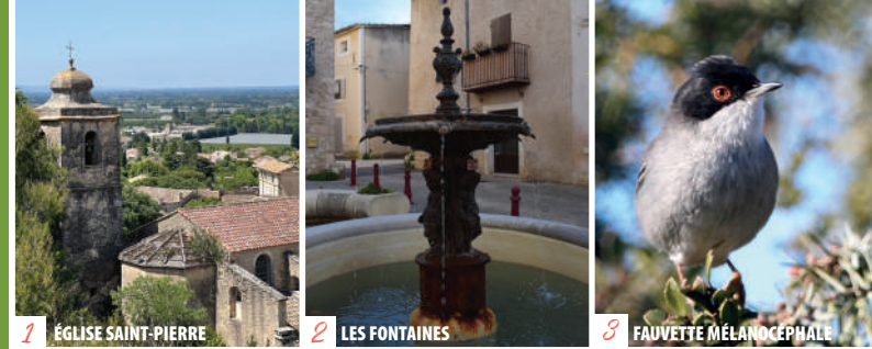
1 ÉGLISE SAINT-PIERRE